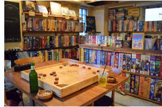
hello coffee stand（滋賀県）