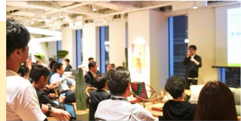
1月22日 <埼玉県横瀬町> よこらぼ東京イベント 町長と語ろう！