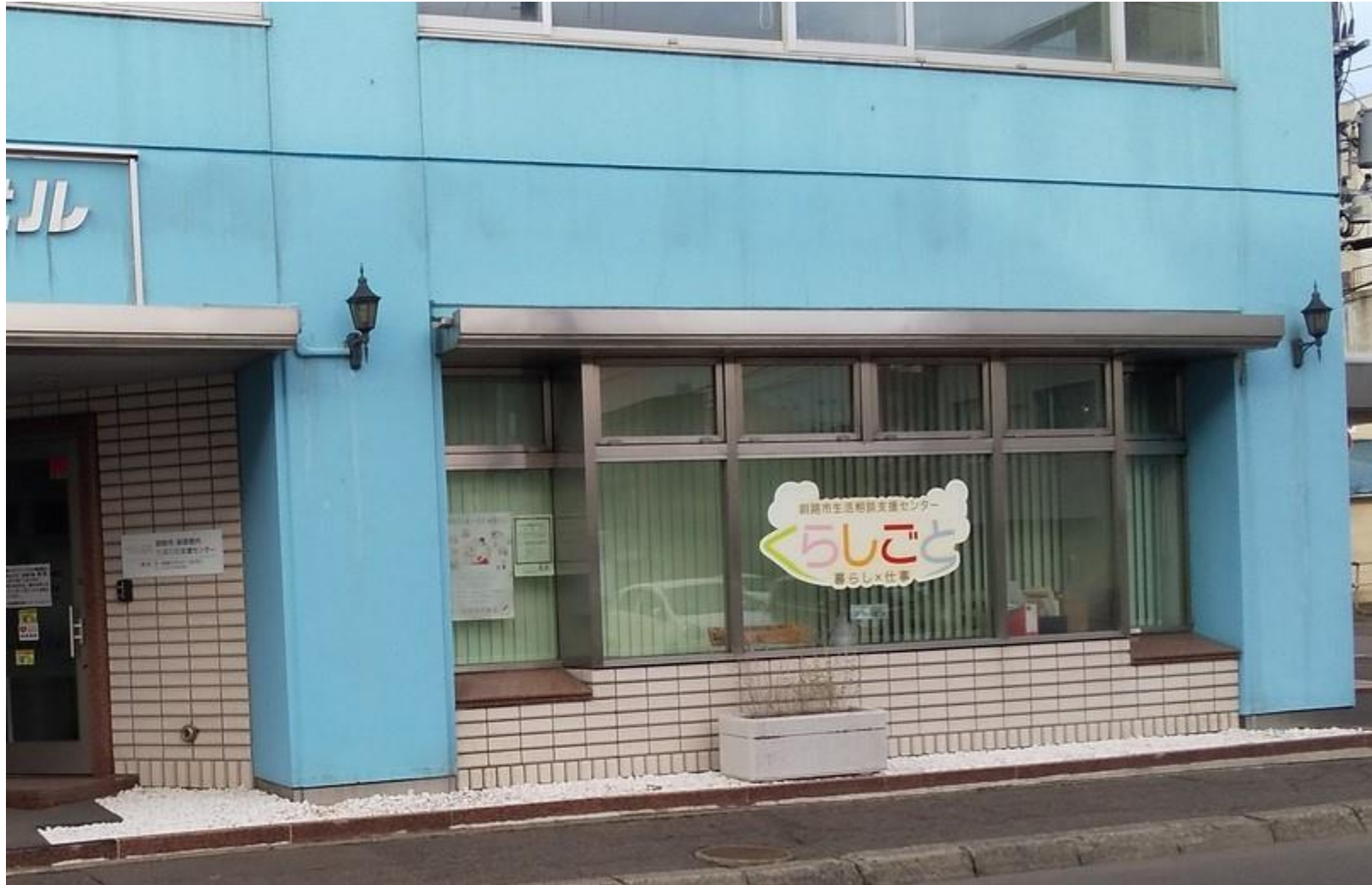
鉏路市生活相談支援センター「暮らしごと」