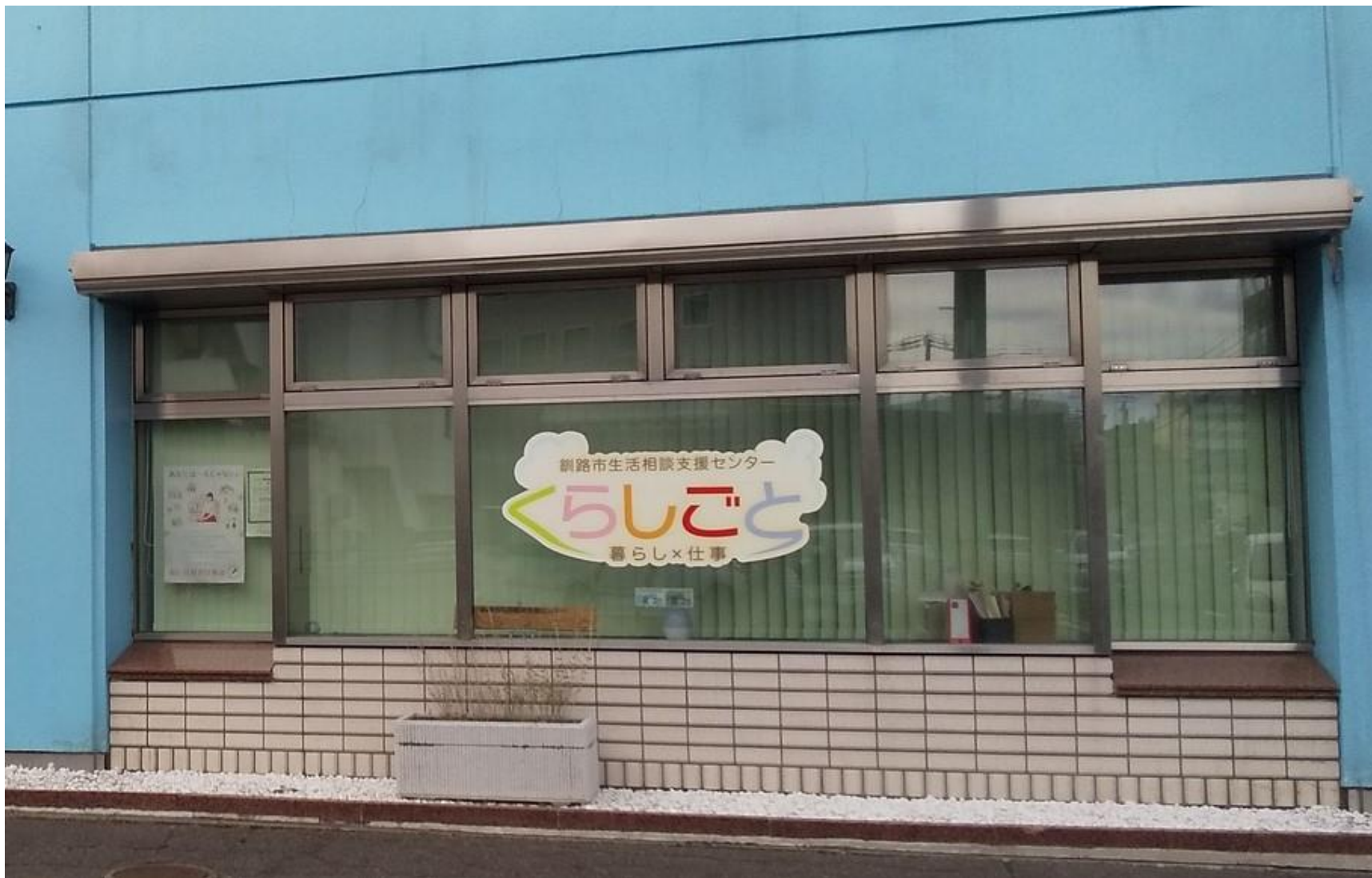
釧路市生活相談支援センター「くらしごと」