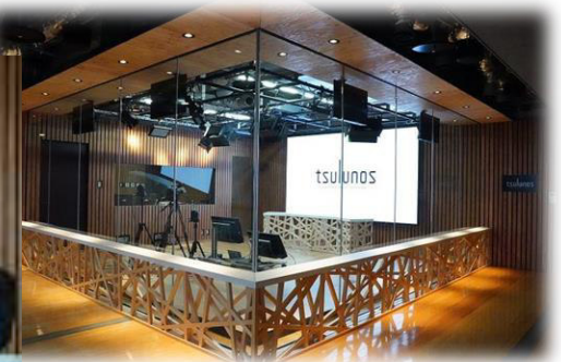
県動画放送スタジオ「tsulunos」