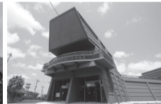
種子島開発総合センター 鉄砲館