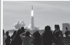
種子島宇宙センター

「鉄砲伝来の地」であり、島の東南端には、日本最大の発射場「種子島宇宙センター」があります。産業は農業が中心で、さとうきび、さつまいも（主に安納いも）、畜産等が盛んです。観光面では、国内外の珍しい古式銃を展示している鉄砲館や、犬城（いんじょう）海岸、千座の岩屋、門倉岬等の景勝地があります。